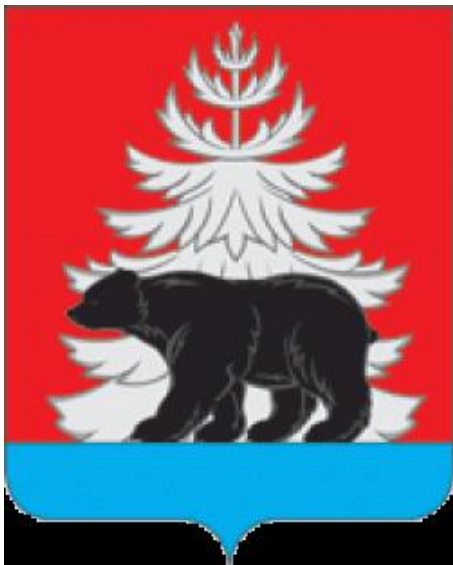
Герб Зиминского района

Города Зима и Саянск в подведомственную территорию района не входят.